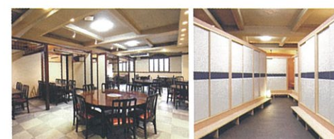
【長崎ダイニングたつや】