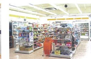
【コンビニエンスストアYショップ】