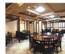
【長崎ダイニングだつや】