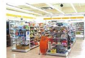
【コンビニエンスストアYショップ】